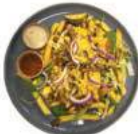
Frites Kapsalon Shoarma (varkensvlees) met sla mix, tomaat, komkommer, rode ui, kaas, knoflooksaus en peppaco saus €9,95