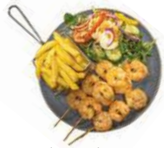
Plate Garnalenspies Rauwkostsalade en frites of stokbrood €17,95

Meerprijs raspatat: 0,50. Ook mogelijk met nasi of bami, meerprijs: 3,00