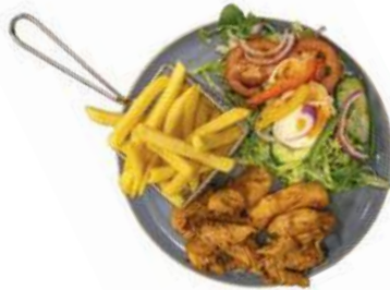
Plate Hete kip Rauwkostsalade en frites of stokbrood €14,75