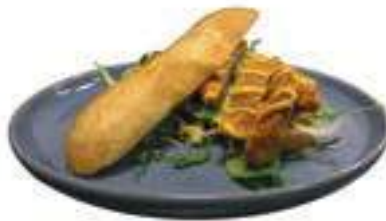
Pistolet Gefrituurde kip Gefrituurde kip met sla mix, rode ui en honing-mosterdsaus €7,25