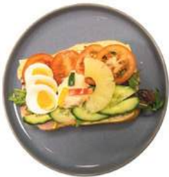
Pistolet Gezond Kaas, ham, tomaat, komkommer, slamix, ei, huzarensalade en ananas €7,00