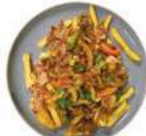
Boerenfrites Spek, champignons, paprika, ui en prei €9,95