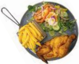
Plate Halve kip Rauwkostsalade en frites of stokbrood €14,75