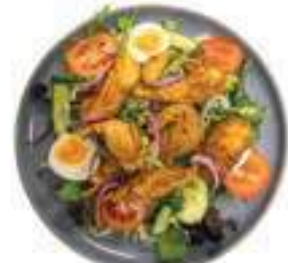
Hete kip Salade Hete kip met slamix, rucola, tomaat, komkommer, ei en rode ui €11,50