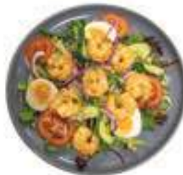
Garnaal Salade Garnalen met slamix, rucola, tomaat, komkommer, ei, rode ui en pittenmix €13,25