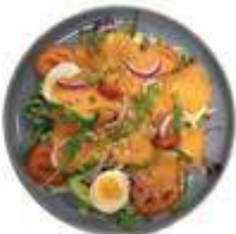
Zalm Salade Zalm met slamix, rucola, tomaat, komkommer, ei, rode ui, pittenmix en gedroogde tomaat €13,25