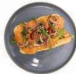
Pistolet Zalm Zalm met roomkaas, rucola, rode ui, gedroogde tomaat en pittenmix €9,25