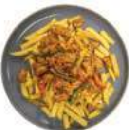
Frites Kipfilet Verse kipfilet met paprika, rode ui en chilisaus €9,95